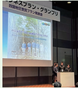
当日の発表の様子

今回の経験を通して、生徒たちは「地域の課題は、地域の中にこそ答えがある」ことを学びました。これまで支えてくださった地域の皆さまへの感謝の気持ちを忘れず、今後も地域とともに歩む学びと挑戦を続けていきたいと考えています。