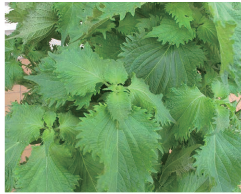
「大葉青しそ」 生育旺盛で栽培 しやすい葉ジソ

原産地はモンスーン気候で夏は海から暖かく湿った季節風が吹き暑く、前線が停滞し雨が多くなります。このためジソは一定の葉枚数になり、夕方の薄明期を含む日長が14時間以下になると花芽を作る短日植物です。花が咲くと葉の収穫が難しくなるので、種まきは日長が14時間を超えるゴールデンウィーク頃からの長日期間にすると長く収穫できます。温暖地ならこの頃、気温が生育温度の下限を超えるので、外で育てるにも好都合です。