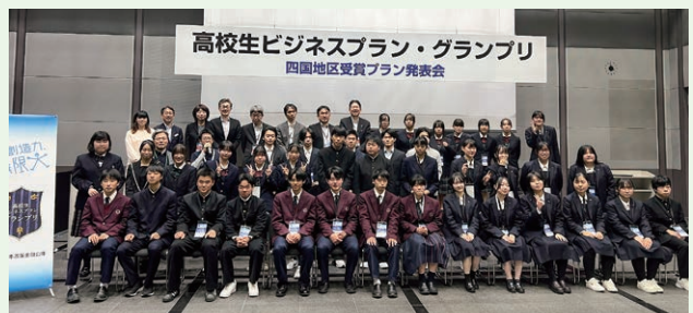
発表終了後の記念撮影