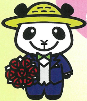
JAバンクえひめキャラクター ばんじゃくん

人生にはさまざまな ライフイベントがあり 意外とお金がかかります! コツコツと月々の 定期積金で安心の生活を おくりましょう!